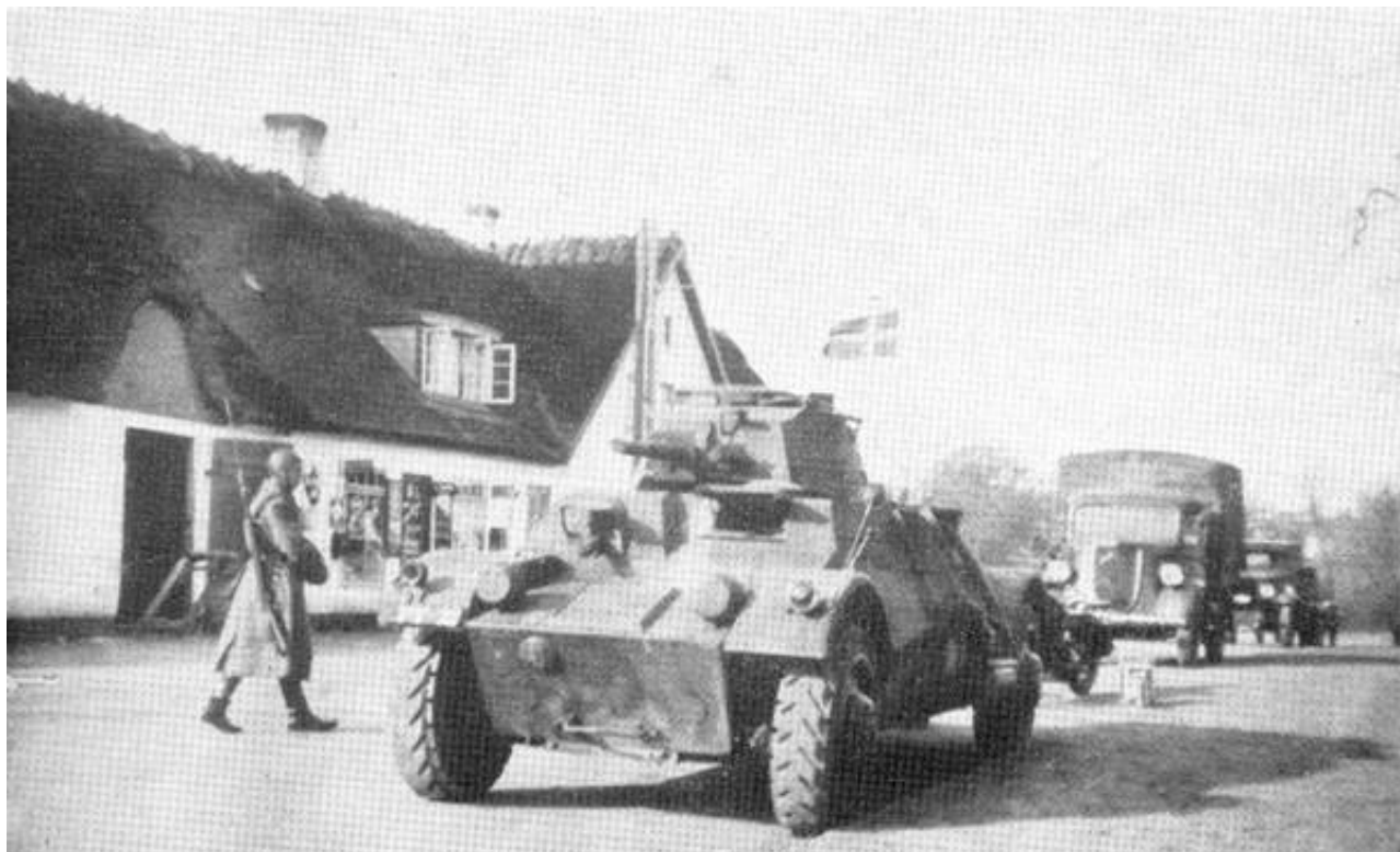
Dele af Gardehusarregimentets Faksegruppe den 9. april 1940.

Styrken blev benævnt Faksegruppen 1 ) og bestod - ud over panservognseskadronen og cyklisteskadronen - af 12 små forskelligartede fodfolkskompagnier, 2 batterier, 1 pionerkompagni og 1 telegrafkompagni 2 ). (Kilde 3.)