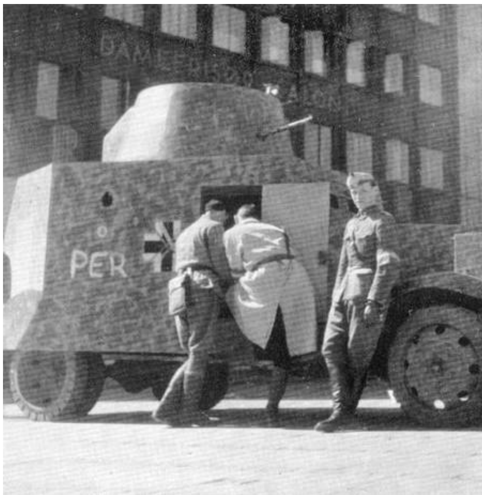
Forsøgspanservogn 1 eller 2 i tysk bemaling, fotograferet 8. maj 1945. Fra Kilde 1.

Henset til periodeafgrænsningen er det ikke her tanken at beskrive rytterregimenternes situation under Besættelsen, herunder træfningerne mellem tyske og danske enheder den 29. august 1943.